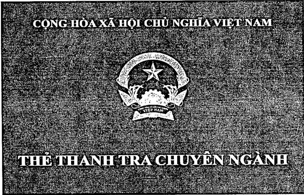
Hình 2. Mặt sau